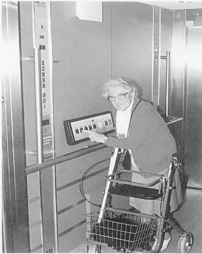
Beispiel einer gelungenen Liftsanierung in einem Blinden- und Sehbehindertenheim in Zürich: Zusätzliches Behindertentableau, doppelte Stockwerkerkennung (oben im Bild der Lautsprecher), erhabene Taster mit eingravierten Normalbuchstaben und Braille-Schrift, gut gekennzeichnetes Nottelefon.

den Bedienungstableaus, die bei kleiner Berührung ansprechen.