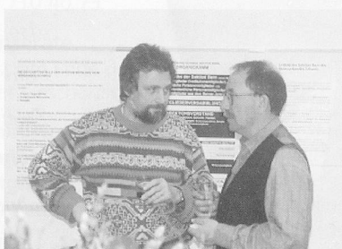
Tagung des Berufsverbandes

Bericht des Zentralsekretärs «Züglete» der Sektion Bern