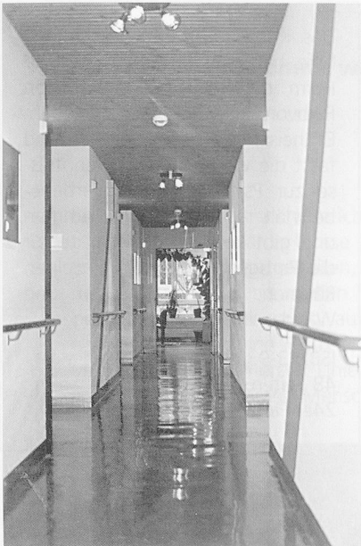
Licht und Farbe: Neues Lichtkonzept macht die Gänge freundlicher, APH Gundeldingen, Basel. Die farbig abgestuften Diagonalstreifen verkürzen optisch den langen Gang.

lohnt es sich, wenn der Entschluss für eine Farbgestaltung des Heimes gereift ist, sich mit Farbe genauer zu befassen, denn sie kann viel zur Stimmung beitragen – im Positiven wie im Negativen. Durch Farben lassen sich Stimmungen kanalisieren, abschwächen und verstärken. «Bekennen Sie Farbe!», ist man versucht zu empfehlen. «Aber nicht irgendeine!», bleibt anzufügen.