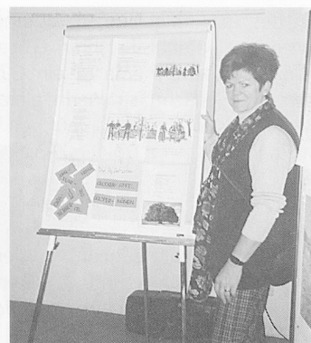
«Kurz-Lektionen» und «Marktstandpräsentation» der Projektarbeiten am letzten Kurstag.