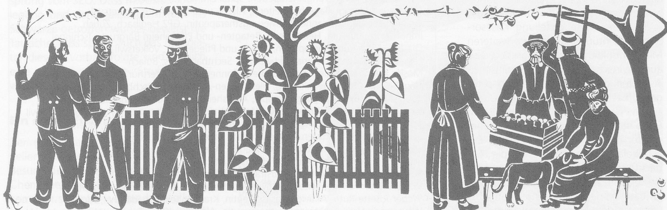
Übergabe der Stiftungsurkunde und Apfelernte-Szene auf einem Wandbild des Dienstbotenheims Oeschberg.