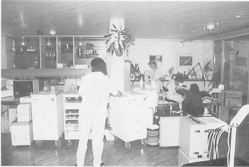
Ein Raum mit Stromanschluss und fließendes Wasser genügt, um die Klinik am Ort einzurichten.