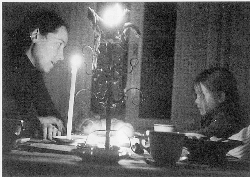
Wärme, Kerzen, Geschichten: Hinabsteigen in das Reich der Seele.

Als unsere Kinder klein waren, habe ich sie oft auf Spaziergänge ins Dunkle mitgenommen. Dieses Gehen in der Nacht ist in starker Erinnerung geblieben. Weil im Dunkeln die Ungewissheit immer ein paar Schritte neben einem hergeht, suchten wir ganz natürlich mehr Nähe zueinander. Die Gedanken, die ausgesprochen wurden, kamen aus der Tiefe. Kinder können wunderbare Sinnfragen stellen und sie mit Leichtigkeit gleich selbst beantworten. Oder es sprudelte die Fantasie. Ich erinnere mich, wie wir Geschichten ausdachten