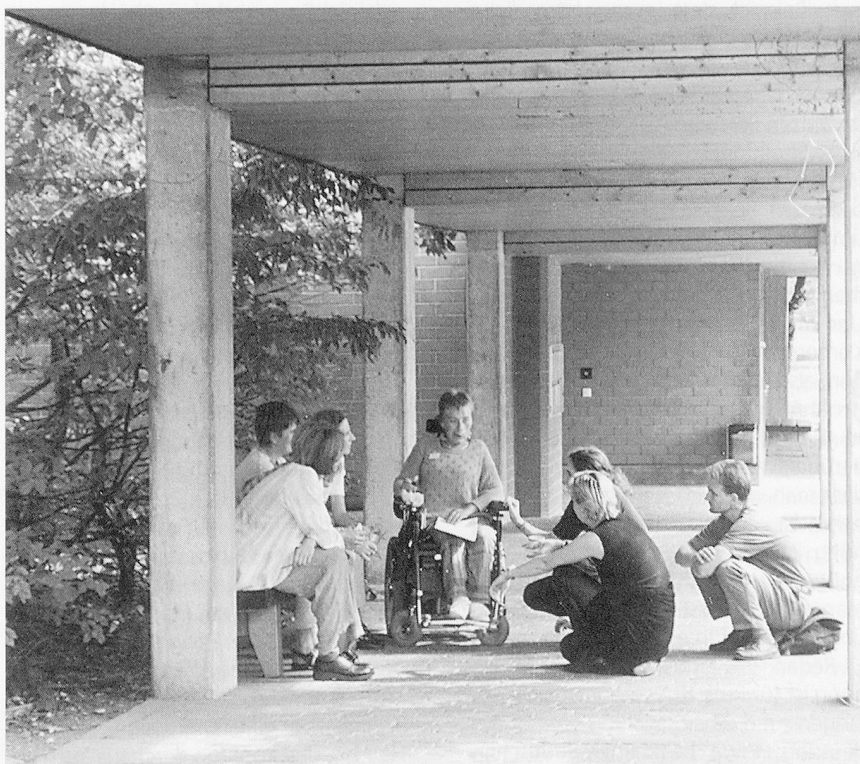
Angeregter Gedankenaustausch im Pausenhof des Schulheims für körperbehinderte Kinder in Aarau.

In vielen Fällen sei intensive Beziehungsarbeit nötig, damit man das nötige «Gschpüri» für ein Kind entwickle, fand eine Therapeutin in einer Arbeitsgruppe. Die Beziehungsarbeit beanspruche oft einen grossen Teil ihrer Therapiestunden, was bei ihr gelegentlich Schuldgefühle auslöse. – Eine gute Beziehung ist die Basis für fruchtbare Zusammenarbeit, entgegnete ihr eine Berufskollegin. Allerdings: Wenn man bedenkt, dass ein Kind im Laufe eines Schultages mindestens zehn Beziehungen pflegt beziehungsweise pflegen muss, kann man leicht nachvollziehen, dass sich dieses Kind nicht auf alle Bezugspersonen gleichermassen einlassen kann und will. Möglicherweise ist die grosse Zahl der Bezugspersonen nämlich ganz einfach eine Überforderung. – Brigitte Schaub erlebt es zwar