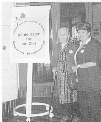
Qualitomania in der SSBL ISO-Norm 9001 für Schulheim Effingen