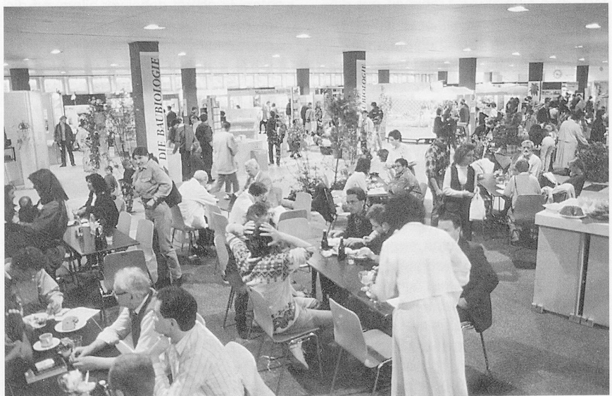
Über 240 Aussteller aus dem Natur- und Gesundheitsbereich präsentierten sich an der diesjährigen OEKO & PARACELSUS-Messe Zürich.

Es gibt verschiedene Versuche, die Wirkung von potenzierten Heilmitteln zu erklären. Gemäss Breu gelang es in jüngster Zeit einem Forscherteam, physikalische Signale homöopathischer Hochfrequenzen mittels nuklearer Magnetresonanz nachzuweisen. Insgesamt muss jedoch gesagt werden, dass weder die Wirkung des Ähnlichkeitsprinzips noch die Wirkung von Hochpotenzen erklärbar ist. Die Heilerfolge, welche bei der Behandlung mit homöopathischen Heilmitteln beobachtet wer-