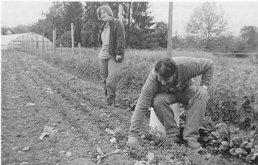
Die arbeitsintensive Biogärtnerei auf dem Bürklihof in Werrikon ZH bietet zahlreichen Menschen die Möglichkeit zu sinnvoller Beschäftigung.

Die Gärtnerei wird vom Bundesamt für Sozialversicherung subventioniert. Wohngruppe, Laden und Markt dagegen sind einer ebenfalls gemeinnützigen Tochterstiftung, der Stiftung Unterstützungsfonds der Stiftung für Ganzheitliche Betreuung , angegliedert und müssen selbsttragend beziehungsweise gewinnbringend sein. Dieser Gewinn wird ausschliesslich für die Finanzierung der Heimtaxen von finanzschwachen Bewohnern und Bewohnerinnen im AHV-Alter verwendet. Die Stiftung für Ganzheitliche Betreuung hat es sich