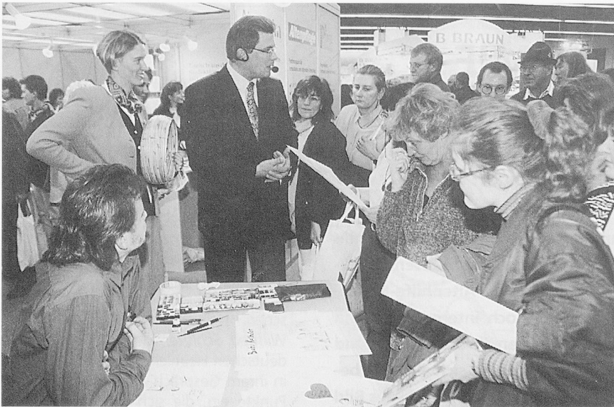
Besichtigungen, Informationen, Aktionen: Die 637 Aussteller boten in sieben grossen Messehallen alles, was auf dem Altenhilfemarkt heute zu haben ist.