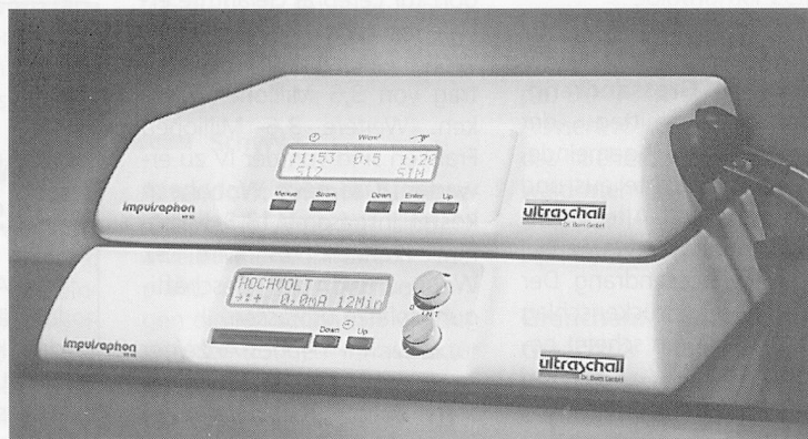
Impulsstation NT 50 und NT 95

Impulsaphon NT 95 , preisgünstiges Elektrotherapiegerät für die Kombinations- therapie.