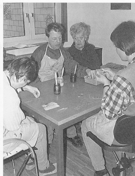
Wohnen im «Sternbild»: Blick aus dem Wohnzimmer; in der Küche dampft es; präzises Arbeiten mit Perlen.

quenz auch für den behinderten Bewohner im Heim gültig werden zu lassen. Ausserdem wird davon ausgegangen, dass jeder Mensch die Fähigkeit hat, ein Leben lang zu lernen. Deshalb wird im «Sternbild» nach dem Normalisierungsprinzip gearbeitet, man versucht, auf den Fähigkeiten (Ressourcen) aufzubauen; nicht durch Therapien, sondern durch gemeinsame Alltagsgestaltung, durch ganzheitliche Betreuung und Begleitung des einzelnen Bewohners wird das Ziel angestrebt, das folgendermassen beschrieben wird: «Das Ziel ist, eine optimale Selbständigkeit während seines ganzen Lebens anzustreben und somit seine persönliche Lebensqualität zu erhöhen. Es soll ihm im Alltag ermöglicht werden an der Vielfalt des Lebens aktiv teilzunehmen, soweit es mit den individuellen Voraussetzungen vereinbart werden kann.»