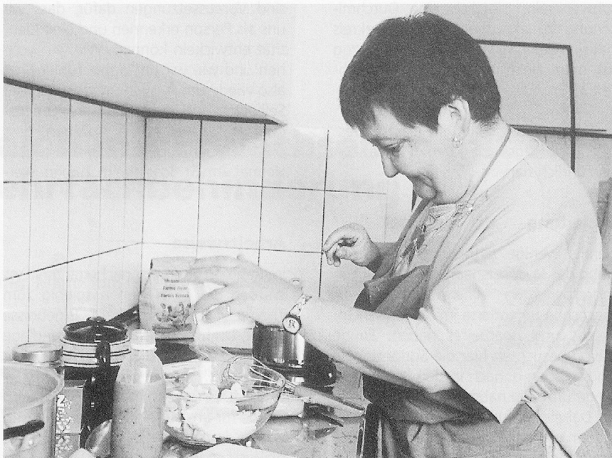
Selbständigkeit üben: Die neuen Wohnformen sind aus den Bedürfnissen heraus entstanden.