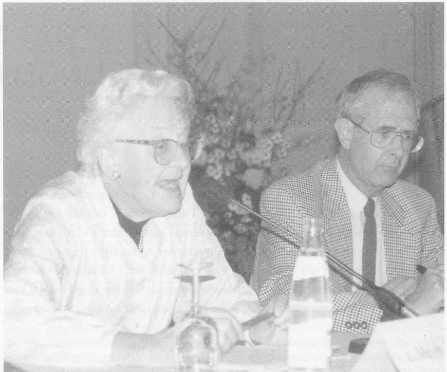
Betroffene: «Wir möchten besser informiert sein.»

müsse. «Ich habe in den 10 Jahren beim Beobachter meine Arbeit gut gemacht. Dieser Vorwurf ist entwürdigend. Sie können doch nicht einfach alle Journalisten in einen Topf werfen.»