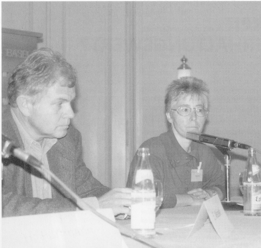
Die Seite der Heime: Information oder Infotainment?