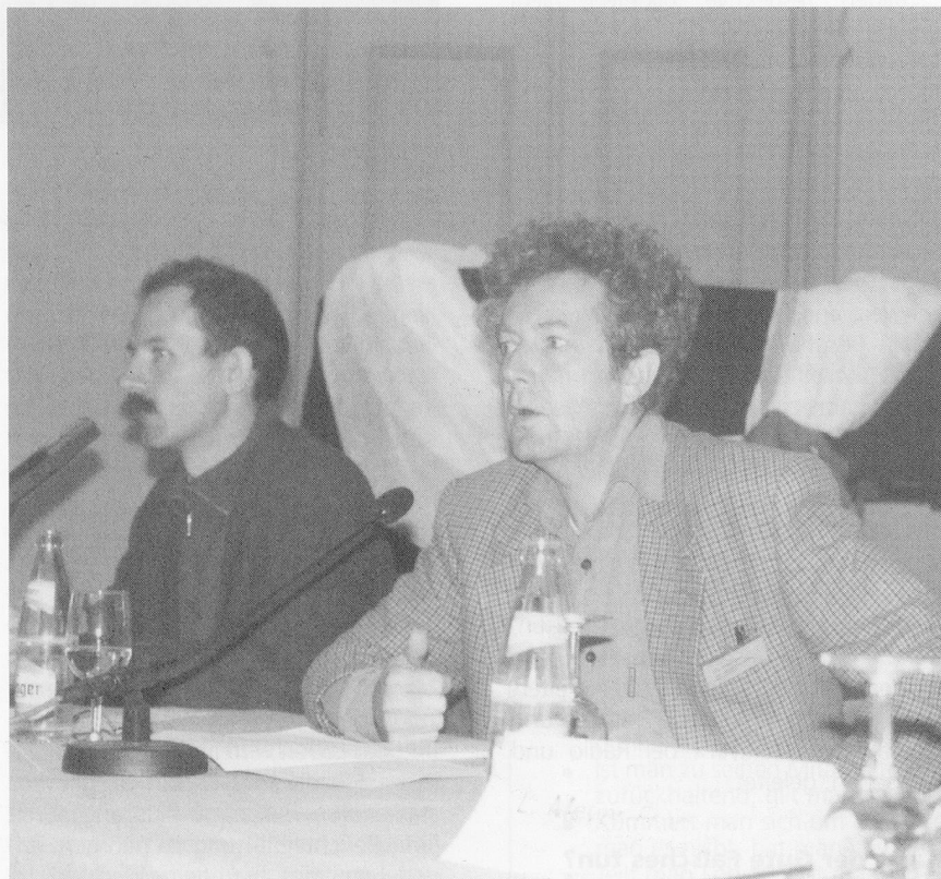
Medienvertreter: Nicht «alle» Journalisten sind «Dreckschleudern»

aktiver Heimleiterin Wut ausgelöst hätten: «Muss das sein? Wir geben uns doch alle Mühe bei unserer Arbeit. Was durch die Medien verbreitet wird, bekommen auch unsere Heimbewohner zu lesen, zu hören, zu sehen. Sie erfahren dadurch Unsicherheit sowie die