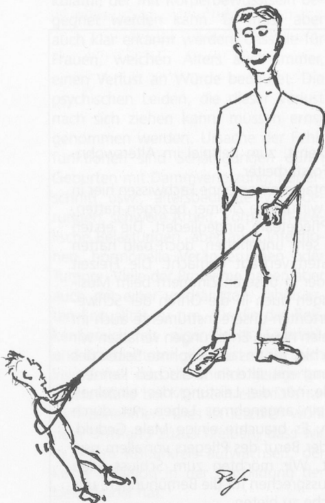
Heimbewohner mit Bezugsperson – doch wer ist jeweils wer? Beide haben ja Möglichkeiten, den anderen zu «stressen» ...