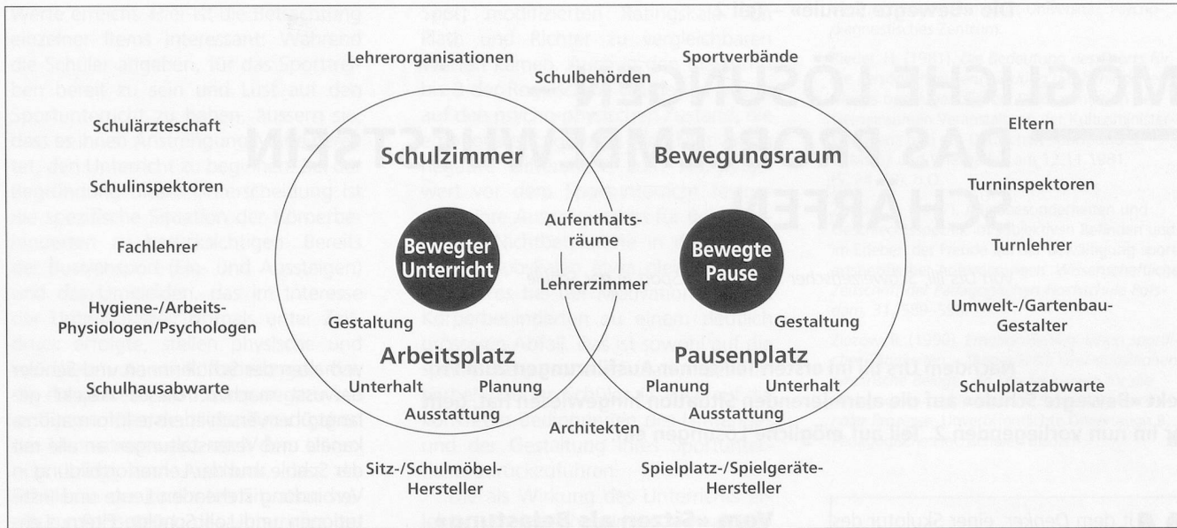
Abb. 4: Beziehungsgefuge in einer «Bewegten Schule».

und umfassenden Massnahmen auch ein wesentlicher Beitrag zur Gesundheitsvorsorge in unserer Gesellschaft geleistet werden. Wir wünschen uns einen Lebensraum Schule, worin alle – den schulischen Lebensalltag beeinflussenden – Entscheidungssträger die umfassende Bedeutung der Bewegung erkennen, und die Bewegung gleichsam als Lebensprinzip verstehen (siehe Abb. 3).