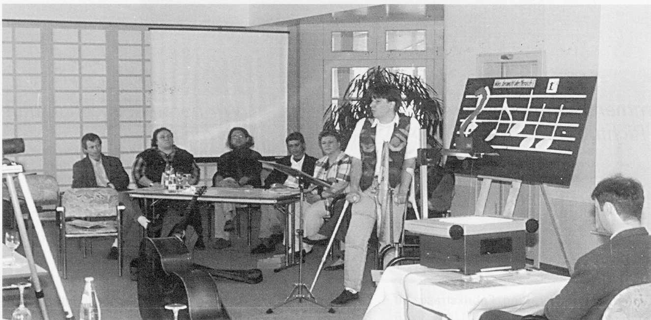
«Was braucht der Mensch?» – Aus der Präsentation der Projektarbeit der Gruppe 2.