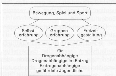
Abb. 1. Bewegung, Spiel und Sport – ein manchmal vergessenes Angebot in der Suchtprävention.

Je nach Art der konsumierten Substanzen vermittelt der Drogenkonsum erregende, dämpfend schmerzlindernde, oft auch veränderte oder dissoziiert erlebte Körpererfahrungen.