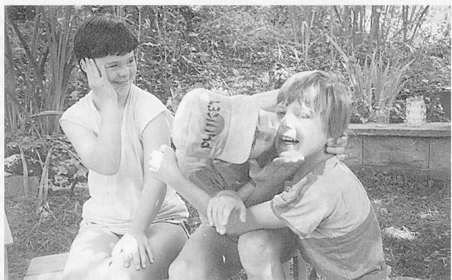
Einander annehmen: «Ich bin hier geborgen.»

Die Photoausstellung zum Buch kann von andern Institutionen gemietet werden. Sie ist leicht transportierbar. Die einzelnen Tafeln sind 50 cm breit und 180 cm hoch. Auskunft erteilt der Heimleiter, O. Wolfer, Heilpädagogisches Heim «Im Sunnehalb», 9655 Stein SG, Telefon 074 4 10 63.