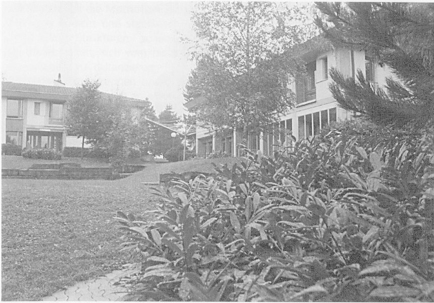
Das Lärchenheim: Eine Hausgruppe am Rande eines Abhangs, alte und neue Gebäude zum Beispiel, wie auf unserer Aufnahme.

hen. Wie es verschiedene persönliche und gesellschaftliche Hintergründe geben kann, die zur Drogenabhängigkeit führen können, braucht es auch verschiedene Behandlungsmöglichkeiten. Das Lärchenheim sieht sich als eine solche Möglichkeit an, die aber nicht den Anspruch erhebt, für alle Drogenabhängigen die richtige Lösung zu sein.