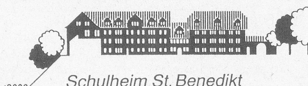
Schulheim St. Benedikt 5626 Hermetschwil

Ist es, die uns anvertrauten 40 erziehungs- und verhaltensschwierigen, oft auch soziokulturell benachteiligten jungen Menschen ihren Anlagen entsprechend erzieherisch und schulisch so zu fördern, dass sie fähig werden, ihr späteres Leben als integrierte Mitglieder unserer Gesellschaft selbstständig zu gestalten und zu meistern. Diese Aufgabe können wir inmitten einer grosszügigen Anlage, in modernen, den verschiedenen Arbeitsgebieten einzeln zugeordneten Gebäuden wahrnehmen. Zur Erfüllung dieser Aufgabe sind wir ab Neujahr auf die Mitarbeit einer weiteren