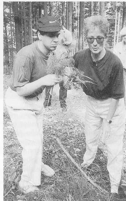
Die Welt an konkreten Handlungen messen.

Dass die mangelhafte, oder anders ausgedrückt, Behinderten-nicht-gerechte Betreuung in Griechenland grossen Einfluss auf die Lebensqualität und die Lebensdauer der Schwerbehinderten ausübt, belegen folgende Daten: Während die Lebenserwartung der «Nichtbehinderten-Bevölkerung» über dem europäischen Durchschnitt steht, ist die Sterblichkeitsrate bei den Schwerbehinderten im Vergleich zum europäischen Durchschnitt um 20 Prozent höher. Daraus entnehmen wir, dass die