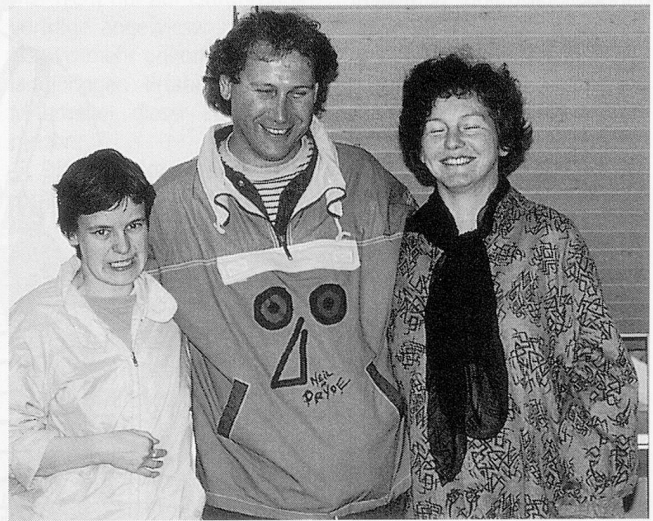
Erwartungsvolle Spannung und freundschaftliche Begegnungen prägten den 1. Erlenbacher Volksmarsch für Behinderte und Nichtbehinderte

Anschliessend können wir zufrieden auf diese Veranstaltung zurückblicken. Der erste Erlenbacher Volksmarsch hatte ein sehr positives Echo, und wir werden alles daran setzen, das Angefangene noch etwas auszubauen, aber trotzdem als gemütliche, überschaubare Veranstaltung weiterzuführen. ■