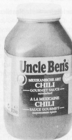
Uncle-Ben's-Sauce Minute «Chili»: Temperamentvoll wie die Natur Mexikos.

Ben's-Sauce Minute treffen Sie genau den Geschmack Ihrer Gäste, denn der Trend zum Genuss internationaler Speisen im Restaurant ist auch bei uns bereits deutlich spürbar.