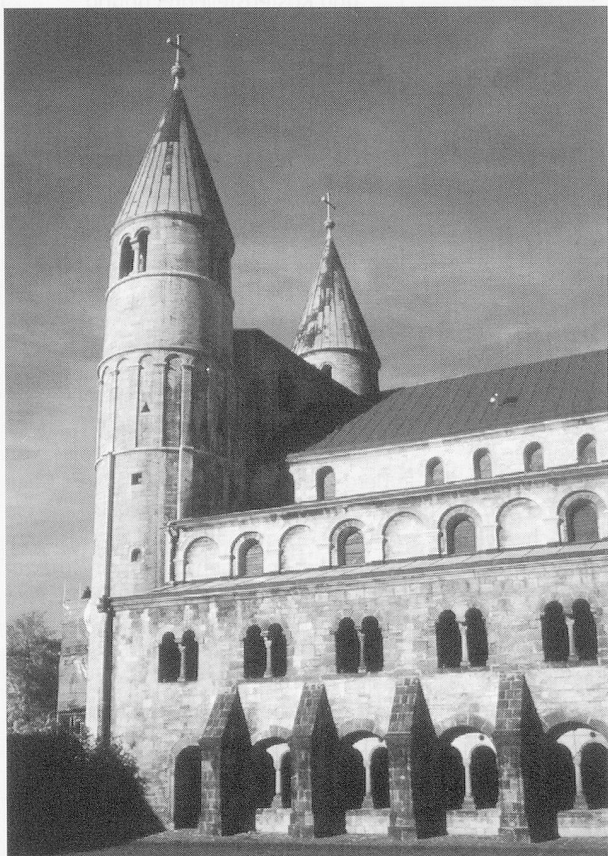
Romanische Stiftskirche in Gernrode.

Kurz nach 17 Uhr treffen wir in Bern ein. Im Bahnhof wimmelt es wie in einem Ameisenhaufen. Ein beissender Geruch schlägt uns entgegen: Tränengas. Ein Empfang, der nachdenklich stimmt. Später vernehmen wir, dass eine Demonstration gegen Rassismus mit einer Auseinandersetzung zwischen der Berner Polizei und randalierenden Jugendlichen gewaltsam zu Ende gegangen ist. ■