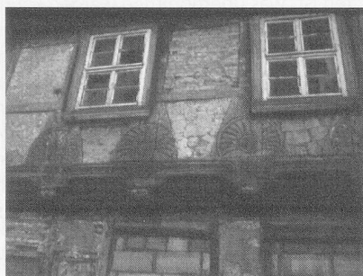
Kunstvolle Schnitzereien an einem Fachwerkbau in Quedlinburg.