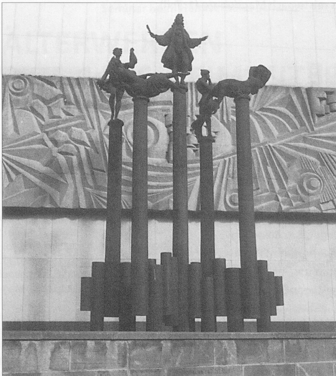
Telemann mit seinen Musen...

leicht meinte die junge Frau gestern dies: Magdeburg ist keine Idylle, wo heimelige Altstadtfassaden eine falsche – äusserliche – Kontinuität vorgaukeln. Zerstört ist zerstört: 90 Prozent des Stadtzentrums lag 1945 in Trümmern. In der Nachkriegszeit wurde das Stadtbild geprägt durch weitläufige, breite Verkehrsanlagen, pompöse stalinistische Prachtsbauten und durch die kahlen Blöcke des Industriefertigbaus. Und trotzdem: die Geschichte ist gegenwärtig, nicht nur die neuere, auch die ältere, wie sie uns heute im Dom aufgezeigt wurde. Je weniger sichtbare Spuren vorhanden sind, um so bewusster muss man sich aus diesem Wenigen die Bezüge, den Überblick «erschaffen». Die Brüche, die Risse, die Kluft zwischen den Stilen wecken auf – zwingen, über Zusammenhänge nachzudenken, die (geistige) Brücke zu schaffen.