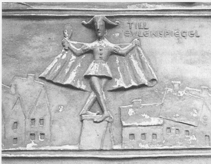
Modernes Bronzerelief am Rathausstor.

platz verschiedene Statuen und Monumente. Ins Auge springt uns das Till-Eulenspiegel-Denkmal... Und plötzlich erinnere ich mich an eine Till-Eulenspiegel-Geschichte, die ich als 3.-Klass-Bub im Lesebuch «Roti Rösli im Garte» gele-