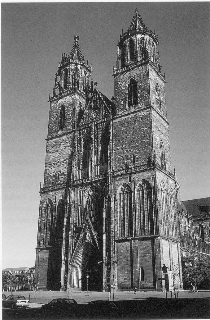
Die Türme des Doms in Magdeburg.

pisch für die niedersächsische Baukunst sind die farbigen Holzschnitzereien an den Häusern, besonders auffällig die Fächerpalmetten oder Sonnenräder. Echte Hochstufhäuser treffen wir an auf unserem Rundgang, entlang älterer, aber auch neuerer Geschichte: Wessis, die alte Häuser erwerben und dann in Konkurs gehen, oder noch schlimmer, weil beabsichtigt, keine Investitionen tätigen, die Häuser verfallen lassen, sie dann abreißen und teures Bauland verkaufen wollen – wir hatten eine wunderbare Stadtführerin, eine echte Brockenhexe mit träfen Sprüchen und spitzer Zunge, kritisch (nicht nur gegenüber den Wessis), aber humorvoll – vielleicht eher Galgenhumor, aber anders, so ist es mir heute manchmal vorgekommen, sind Absurditäten in der neueren deutschen Geschichte gar nicht anzugehen. Dann der Besuch der Burg, etwas neben der Stadt gelegen, und der den Hügel krönenden Stiftskirche des Damenstiftes von Quedlinburg, gegründet von Mathilda, der Gattin Heinrichs I., samt Domschatz und wunderbar ausgemalter Krypta – ein herrliches romanisches Gebäude (1129