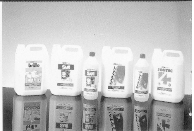
Die ECO-Dynamic Reinigungsprodukte

Selbstverständlich wollen Sie Klarheit darüber, welchen Einfluss die Verwendung bestimmter Reinigungsprodukte auf die Umwelt hat. Nehmen Sie ECO-Dynamic. Ein Produktsortiment, bei dem das ausgewogene Verhältnis zwischen Produktleistung und Umwelt an erster Stelle steht. ECO-Dynamic hat beste Voraussetzungen für effiziente und verantwortungsbewußte Reinigung und wird unterstützt durch sehr klare Produktinformationen, die Auskunft geben über unseren gemeinsamen Beitrag zum Umweltschutz.