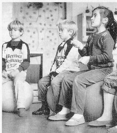
Fall bzw. lineare Bewegung, wie zum Beispiel Federn: