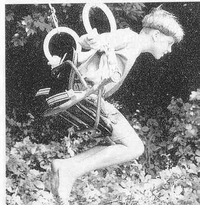
Schwingung bzw. Pendelbewegung, wie zum Beispiel Schaukeln:

Ein gesundes Hirn ist ein Leben lang stets auf der Suche nach rhythmischen Spannungswechseln, die den Energiefluss und damit seine Ernährung sicherstellen. Der eigentliche Antrieb ist ein archaisches Grundbedürfnis, das immer wieder nach stimulierenden Sinnesreizen bzw. nach Bewegung verlangt. Ohne Einfluss von aussen erobert sich das Kind diese Sinnesreize selbst. Die sensomotorischen Reize bilden somit gleichsam den inneren Antrieb zur Entdeckung der Welt wie auch zur Konzentration der Kräfte für das Lernen. Auf der Suche nach einem inneren und äusseren Gleichgewichtszustand entdeckt der junge Mensch auch sein Bedürfnis nach Sicherheit, Beruhigung und Wohlbefinden. Er zeigt oft unbewusst seine Lust, dieses Gleichgewicht zu verschaukeln, indem er seine Bewegungsaktionen auf drei fundamentalen Ebenen sichtbar macht: