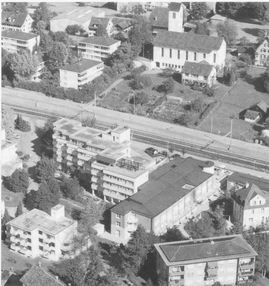
Alters- und Pflegeheim Lanzeln, Stäfa.

Eine enge Zusammenarbeit zwischen Trägerschaft, gemeindeeigenen Verwaltungsstellen und operativer Heimführung wurde mit Hilfe des externen Beraters als eigentlicher Katalysator sichergestellt. Ausserdem wurden verschiedene zusätzliche positive Nebeneffekte erzielt.