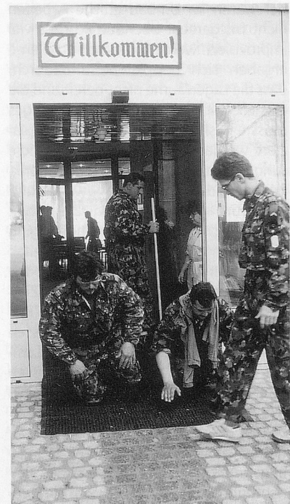
Kurz vor der Ankunft der Bewohner wird noch schnell der Teppich ausgelegt und gereinigt. Auch da macht sich das Militär nützlich.

Die gründliche Vorbereitung ist auch diesmal für den Erfolg der Sache entscheidend. Mit der Tatsache, dass alle Mitarbeiterinnen und Mitarbeiter in die Planung einbezogen wurden, ergab sich eine breitabgestützte Organisation, die