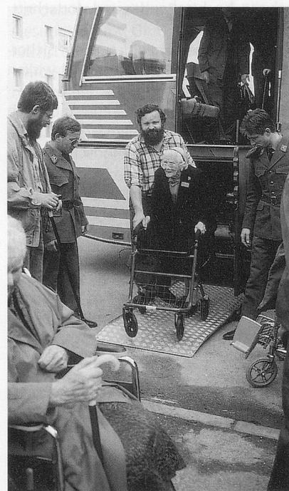
Jetzt ist es soweit! Nach dem Ausflug kommt der langersehnte Einzug ins «neue» Heim.

Haupterfahrung in diesen Jahren: Mit einer positiven Einstellung, mit viel zeitlichem und kräftemässigem Einsatz für Überzeugung und Motivation können Berge versetzt werden.