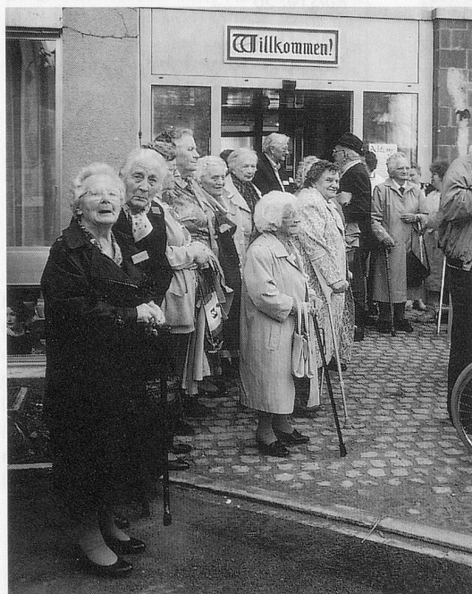
Die Bewohner werden in Aargau willkommen geheissen. Zivilschutz, Militär, Mitarbeiter, Kommissionen, Bewohner, eine gute Durchmischung ...