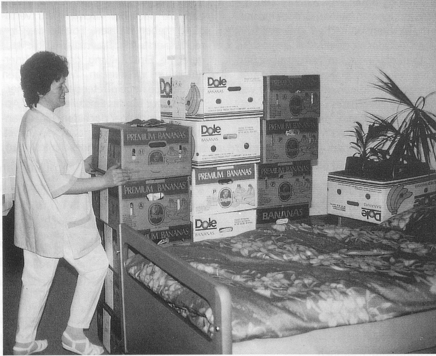
Unmittelbar vor dem Einzug der Bewohner wird noch alles zurechtgebüschelt. Die vollen Kisten warten auf fleissige Hände.

sich in der Praxis ausgezeichnet bewährte. Erfreulich wenig Fehlleistungen waren zu verzeichnen; Zivilschutz, Militär und alle übrigen Helfer wurden mitgerissen und setzten sich ganz enorm ein. Die Presseberichte waren entsprechend positiv.