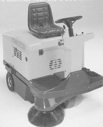
TASKI balimat 100: bis 3'500 m 2 /h