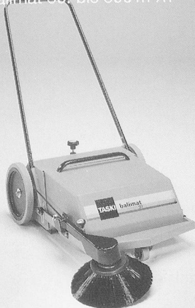
TASKI balimat 50: bis 800 m 2 /h