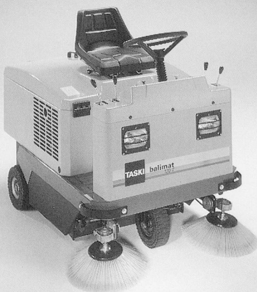
TASKI balimat 130: bis 5'000 m 2 /h