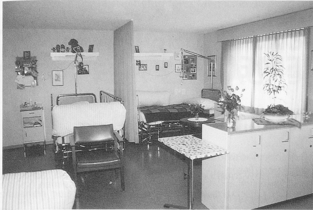
Platz für einen Lieblingssessel neben dem Bett.