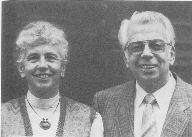
Frauenrundgang Herbsttagung 1994