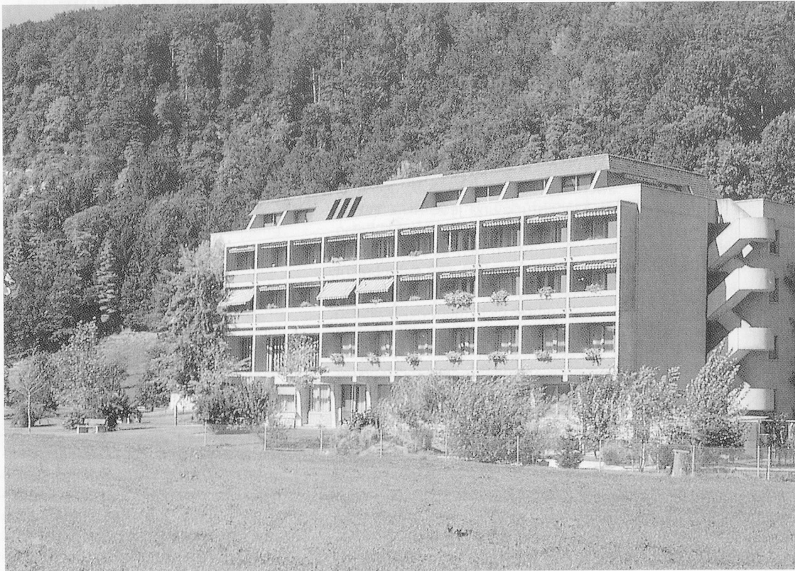
Das «Feriendomizil»: Alters- und Pflegeheim Flumatte, Dagmersellen.

Einige Tage nach Abschluss der Übung führten wir mit dem Personal eine Manöverkritik durch, damit eventuelle Fehler beim nächsten Mal vermieden werden können. Grundsätzlich sollen die MitarbeiterInnen den Umzug als positives Erlebnis in Erinnerung behalten. Deshalb ist auch an Lob nicht zu sparen. Ein festlicher Anlass als Dank für das Mitdenken und Mitarbeiten wäre zumindest angezeigt.