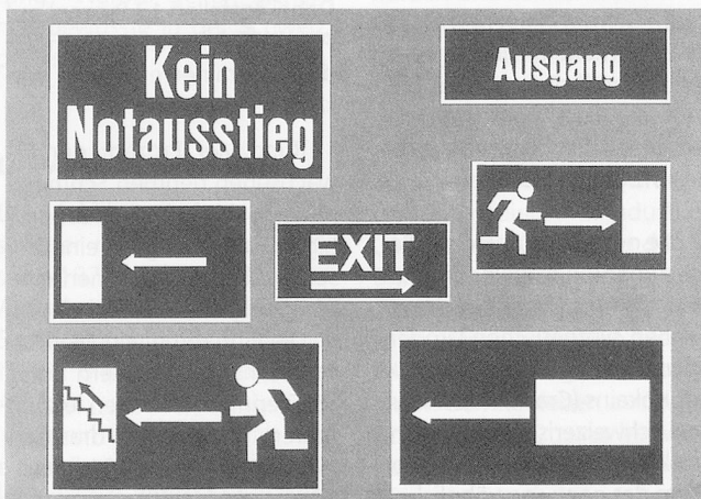
Fluchtwegmarkierung: Wichtig, wenn das Licht ausgeht.

Zeglas AG Luzernstrasse 9 5040 Schöftland Tel. 064 811313