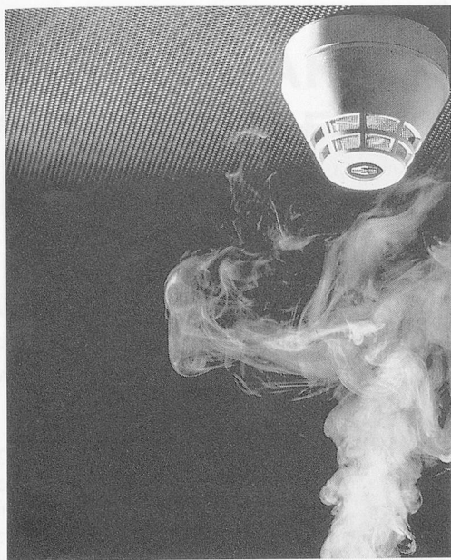
Die neue Generation von Feuermeldern spricht auf Rauch, Hitze und Feuer an.