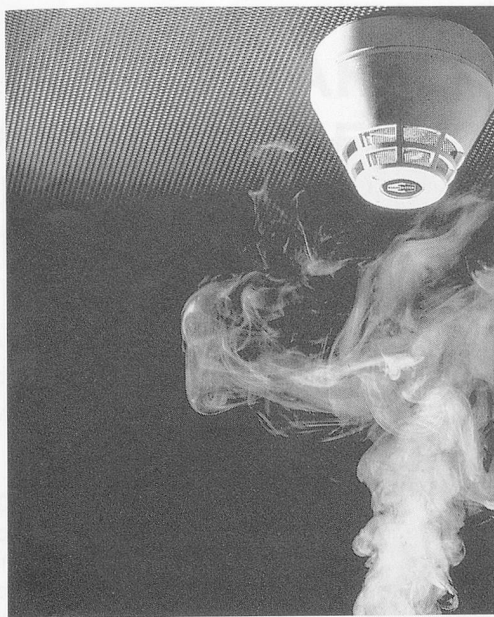
Die neue Generation von Feuermeldern spricht auf Rauch, Hitze und Feuer an.