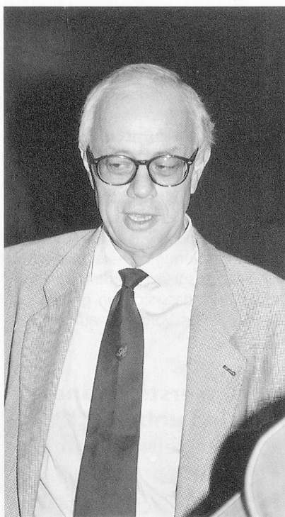
Menschenwürde als Ausgangspunkt allen Denkens und Handelns:

Menschenwürde setzt zunächst zwei Aspekte voraus: die Wertschätzung des Individuums und die Einbindung in eine Wertewelt.