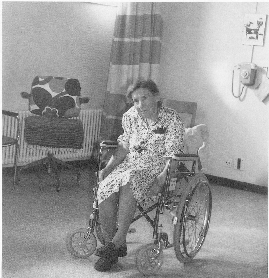
Die Würde des Menschen ist unantastbar.

Insofern bleibt moralisches Handeln zu allererst immer Aufgabe des einzelnen Menschen. Dabei spielt sein Menschenbild eine entscheidende Rolle. Dieses Menschenbild ist sozusagen das Gefäss der Würde, nach dem der Mensch sein Handeln reflektiert oder unreflektiert ausrichten kann.