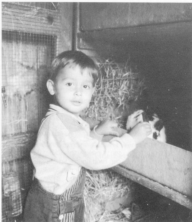
Auch im Tagesheim müssen die Kinder Verantwortung übernehmen.