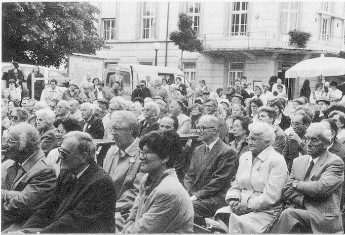
Interessierte Zuhörerinnen und Zuhörer, vor allem der älteren Generation.