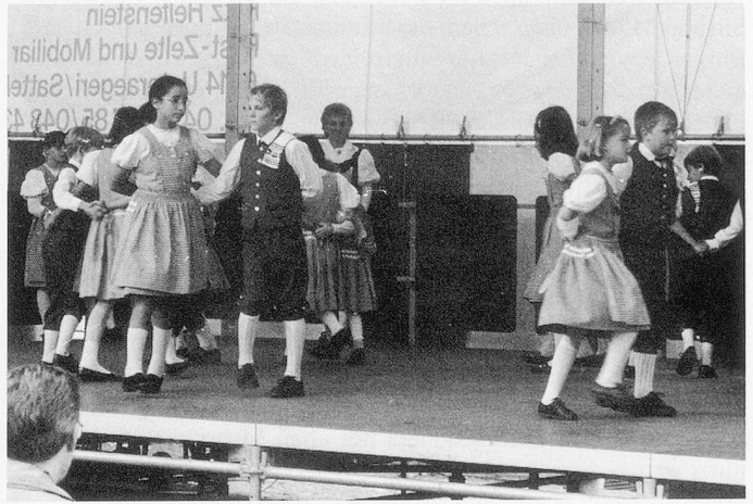
Kinder-Trachtentanzgruppe Zug bei ihrem Auftritt.