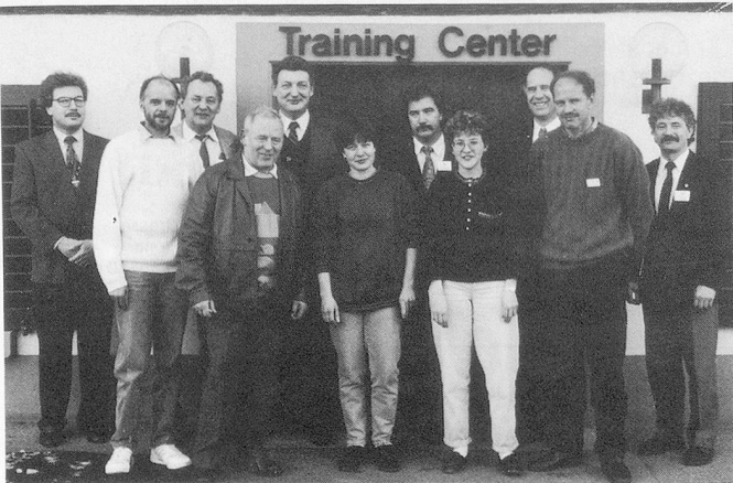
Gruppenbild. Die Diplomanden freuen sich mit einigen Experten über den erfolgreichen Abschluss ihrer intensiven Ausbildung bei Lever Sutter AG, Münchwilen.

Am 26. 2. 1993 absolvierten sieben Kandidatinnen und Kandidaten die Prüfung zum Diplomabschluss als ausgewiesene Fachkraft für Hygiene, Reinigung und Werterhaltung. Den recht hohen Anforderungen waren sechs Absolventen gewachsen und bestanden sie mit Erfolg. Dies war bereits der 19. Diplomtag, den die Firma Lever Sutter AG seit der Premiere im Jahre 1986 durchführen konnte.