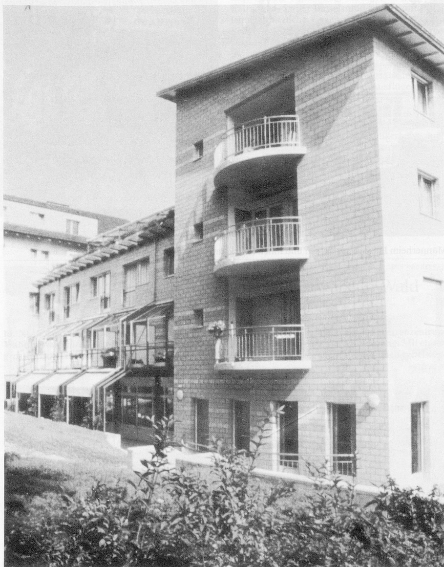
Erweiterungsbau des Tabeaheims, 1991–1993.

Der Neubau ist als Winkelbau konzipiert. Das viergeschossige Hauptgebäude längs der Schärbächlistrasse wird mit einem dreigeschossigen Verbindungsbau an das bestehende Haus 2 an-