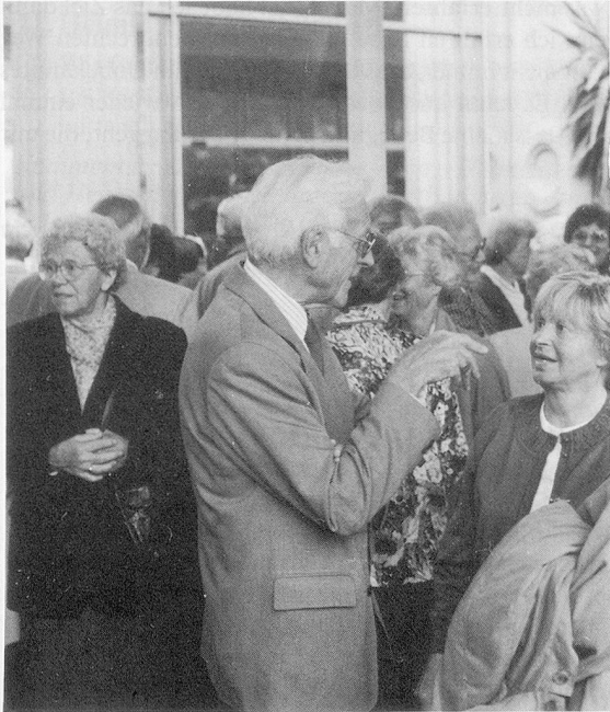
Grosser Bahnhof in Baden: Begrüssungsapéro (links) und Dislozierung zum Hotel Verenhof (rechts).

mck. Einmal grau und verhangen, dann wieder wenige Sonnenstrahlen: Das Wetter wusste nicht so recht, was es wollte. Um so mehr wussten es «unsere» Veteranen und Veteraninnen im Heimverband Schweiz. 96 von ihnen liessen es sich nicht nehmen, das fünfzehnte Veteranentreffen zu besuchen.