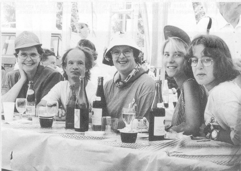
Junge Sportler und Sportlerinnen freuen sich über die herzliche Begegnung mit Bundesrätin Ruth Dreifuss.

hindertensport (SVBS) beteiligten sich am 32. Sporttag. Auch dieses Jahr war der Grossanlass ein Festival des Breitensports, der mit seiner Vielfalt an Disziplinen allen und damit auch schwerst-behinderten Rollstuhlpatienten das aktive Mit-machen ermöglichte. Zwischen den Leicht-athletik- und Mannschaftswettkämpfen wurde gerne die Möglichkeit wahrgenommen, in der Festwirtschaft Bekannte zu treffen und alte Freundschaften neu aufleben zu lassen. Der Schweizerische Sporttag 1994 wird am 3. Juli stattfinden.