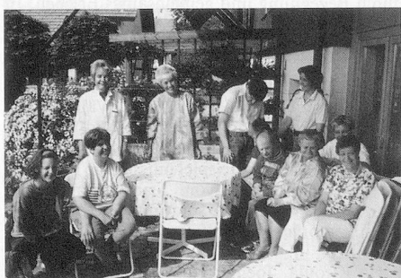
Gruppenbild: fast die gesamte Equipe der Alten Schmitte. So bodenständig wie der Alltag der Menschen, die hier leben – die Alte Schmitte im Dorfkern Lohns (übrige Bilder Heini Müller).