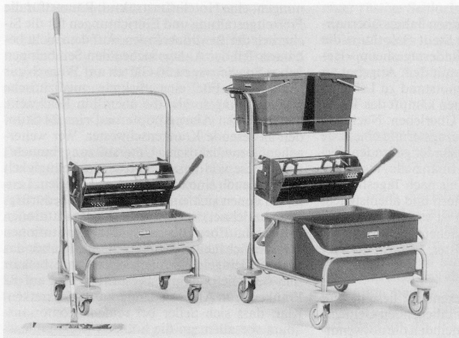
Wetrok-Wetcar 22 und 44, die zwei handlichen Geräteeinheiten mit Flaumern.

Die kompakten und handlichen Einheiten Wetrok-Wetcar 22 und 44 sind ideal für das Nasswischen und Wischpflegen sowie zur Desinfektion von kleinen bis mittleren Hartbodenflächen mit Flaumern. Diese entwickelten Geräte und Flaumer ermöglichen, dank einer Arbeitsbreite von 450 mm, eine erhöhte Flächenleistung.