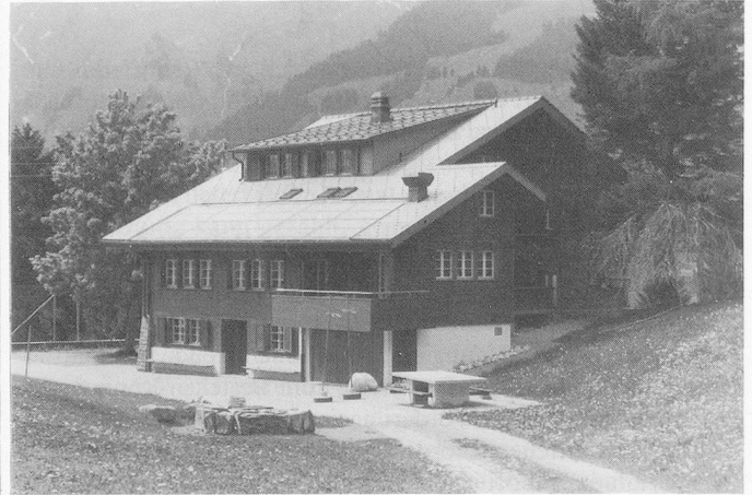
Sonnenenergie für das Ferienhaus «Marchgraben»: Energiespeicher im Haus; 38 Quadratmeter Solarzellen.

Vorher waren 26 kleine Holzöfen im Betrieb, erklärte Christian Schranz , der das Haus verwaltet. Eine Sanierung der Anlage hatte sich aufgedrängt, weil die kleinen Holzöfen in diesem alten Holzhaus eine nicht geringe Brandgefahr darstellten. Die Sonnenenergieanlage, die mit Sonnenkollektoren funktioniert, erzeugt Energie für die Heizung und das Warmwasser. Durch die Solarzellen (auf einer Fläche von 38 Quadratmetern) wird eine frostsichere Flüssigkeit aufgeheizt und die Energie in einem Boiler gespeichert. Fällt die Temperatur im Boiler unter 48 Grad, tritt automatisch der Ölbrenner in Aktion, was vor allem im Winter vorkommt. Im Sommer reicht die Energie aus der Sonne für die Warmwasseraufbereitung aus.