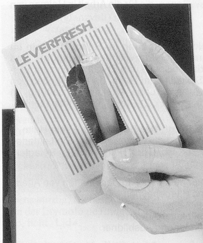
Nachfüllpackung aufreissen und einsetzen...

Jedem das seine: Die praktischen Handwasch-Systeme Leverfresh und Leverlux.