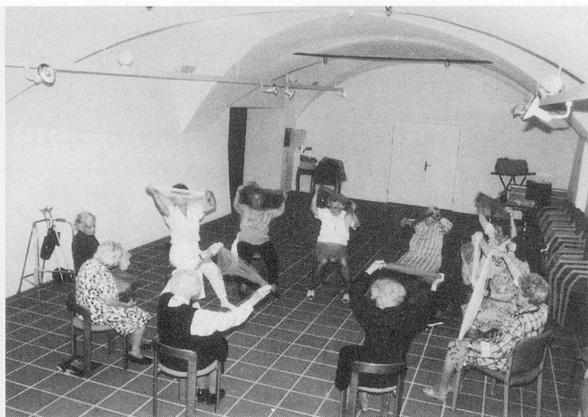
Mit Musik geht alles leichter: eine aussergewöhnliche Turnstunde in Gunten.

Anfragen unter Chiffre V 920801, Admedia AG, Postfach, 8134 Adliswil.