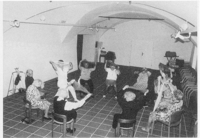
Mit Musik geht alles leichter: eine aussergewöhnliche Turnstunde in Gunten.

Anfragen unter Chiffre V 920801, Admedia AG, Postfach, 8134 Adliswil.