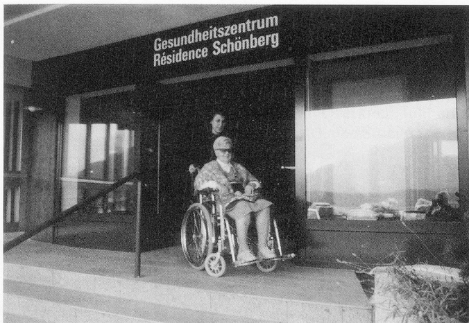
Die Résidence Schönberg ist rollstuhlgängig; guter Teamgeist in der Küche.