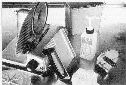
Sumanet, Sumabac, Sumarein: Alles für hygienisch-saubere Küchenmaschinen.