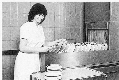
Glänzendes Ergebnis beim Geschirr: Sumazon und Sumabrite.