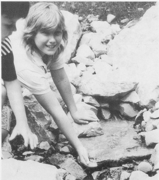
Auch die Quelle ist ein Ursymbol: Lass das Wasser durch deine Hände gleiten . . .