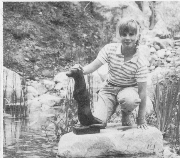
In der Höhlung des Summsteins kannst du deinen persönlichen Ton treffen; ein Fischotter aus Bronze ist Mahnmal für die bedrohte Natur.

eingemeisselt wurden, bilden ein einladendes Tor zum Erfahrungsfeld. «Dennoch – heute» heisst das über dem Torbogen stehende Motto, das zugleich der Titel eines Buches von Hugo Kuekelhaus ist und für die Kinder im Friedberg Da-Seins-Leitmotiv sein soll. Man übt mit ihnen, hier, im «Tor zum Leben», die Realität klar zu erkennen und nach der Standortbestimmung den Entschluss zu fassen, dennoch, allen Widerwärtigkeiten zum Trotz, heute es immer wieder neu zu wagen, miteinander unterwegs zu sein, einander zu helfen und beizustehen , und so zu einer positiven Entwicklung des eigenen Ich beizutragen. Im Zentrum der